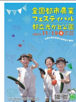
▲イベントポスター