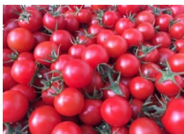
▲糖度 8.5 以上！ 名古屋市の miu トマト