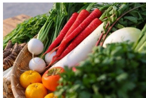
▲金時にんじんや水菜などの 京野菜