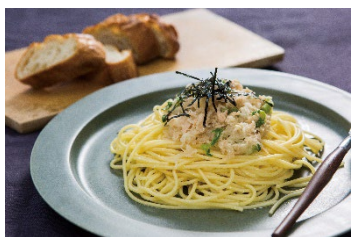
▲練馬区内の給食でも愛されている 練馬大根スパゲティ

また、区内外の農業者が講師となり、都市農業を体験できるワークショップを実施します。