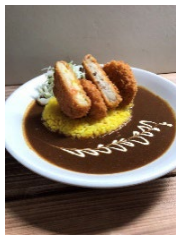
▲こくベジ(国分寺市)の サトイモ使用の コロケカレー