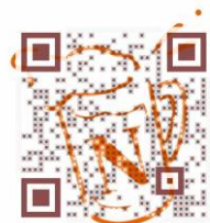
▲イベント HP の 2次元バーコード

国際交流「オーストラリアカフェバン」、ワンコインタロット占い ムンロ王子、お花deサステナブル