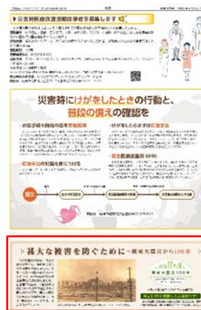
▲8月5日発行の千代田区広報紙

賛同していただいた各区の広報紙に「東京駅前の焼け跡、日本橋方面（気象庁ホームページより）」の被害写真と東京都が作成した関東大震災100年のロゴマークを掲載します。