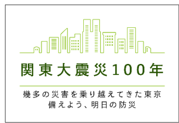
▲掲載される被害写真（東京駅前の焼け跡、日本橋方面（気象庁ホームページより））と、東京都が制作したロゴマーク