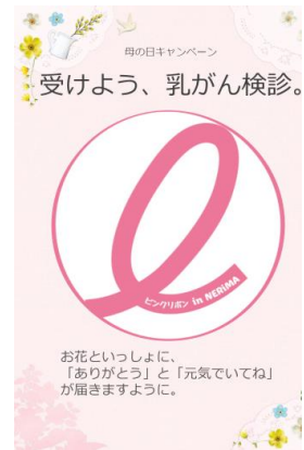
▲検診の普及啓発ポスター