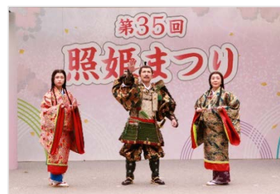
▲昨年の照姫まつりの様子

照姫は、室町時代中期に石神井城を本拠地とし、栄華を極めていた豊島泰経（としま やすつね）公の娘として語り継がれている。戦乱の中、泰経公は宿敵太田道灌（おおた どうかん）に攻め滅ぼされ、現在の石神井公園にある三宝寺池に飛び込んだ。愛娘の照姫は、泰経公の最期をみると、悲しみのあまり自らも池に身を投げ、命を絶ったと言われている。