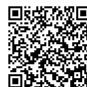
▲イベント HP の 2次元バーコード

フォトスポット、キッチンカー（近接する「あかしあ児童公園」会場）、人気イラストレーター北岸由美さんデザインの限定エコバックプレゼント（先着150名様：対象店舗で2,000円以上お買い上げの方）