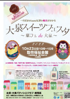
▲イベントポスター