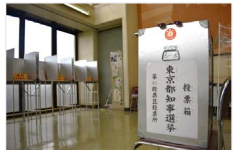
▲設置された投票箱と記載台（井草高校）

なお、模擬投票の開票は、7月10日の参議院議員選挙の開票後に行う。結果は授業や教育活動内での資料として活用し、学校外への情報の提供は行わない。