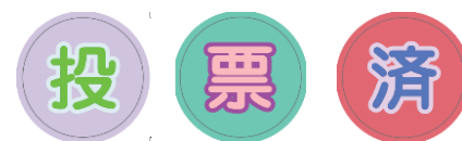
▲投票済証明ステッカー (3種類)