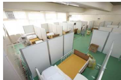
練馬区酸素ステーション