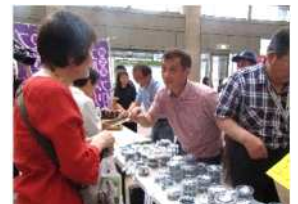
▲過去の開催の様子