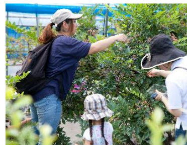
▲ブルーベリー摘み取りの様子