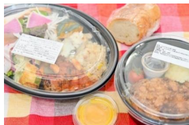
▲販売されるお弁当イメージ