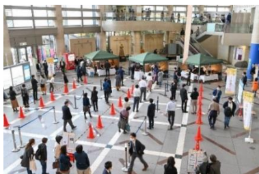
▲お弁当フェス実施時の様子

臨時弁当販売会：令和2年4月24日～5月29日（平日22日間）【出店数】延べ45店舗【販売数】計4,660食 お弁当フェス：令和2年11月17日～11月19日（平日3日間）【出店数】延べ19店舗【販売数】計1,563食