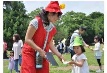
▲サンバイザーをつけて遊ぶ子ども