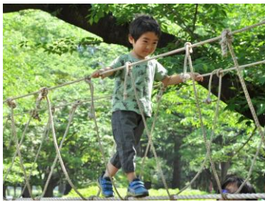
▲モンキーブリッジで遊ぶ子ども