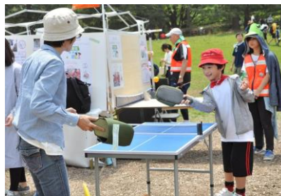
▲スリッパ!!卓球で遊ぶ子ども