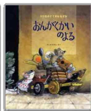
「5ひきのすてきなねずみ おんがくかいのよる」 ほるぶ出版

※保育室(1歳以上の未就学児対象、定員6名)を利用したい方は、4月25日(木)までにお申し込みください。 ◎講演会終了後にサイン会を行います。(先着50名。開場時間から整理券を配布します。参加者が持参した著作1冊に限ります。色紙などは不可。)