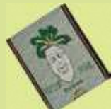
ねりまだいちゃん小銭入れ 加藤堂店