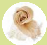
学園桜染綿ストール ライン工房