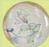
練馬区の花々を描いた小皿2枚セット 夢泉工房