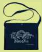
オリジナル ねりこサコッシュ