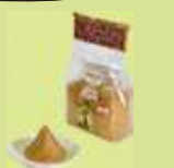
昔みそ（赤・白）セット 糀屋三郎右衛門