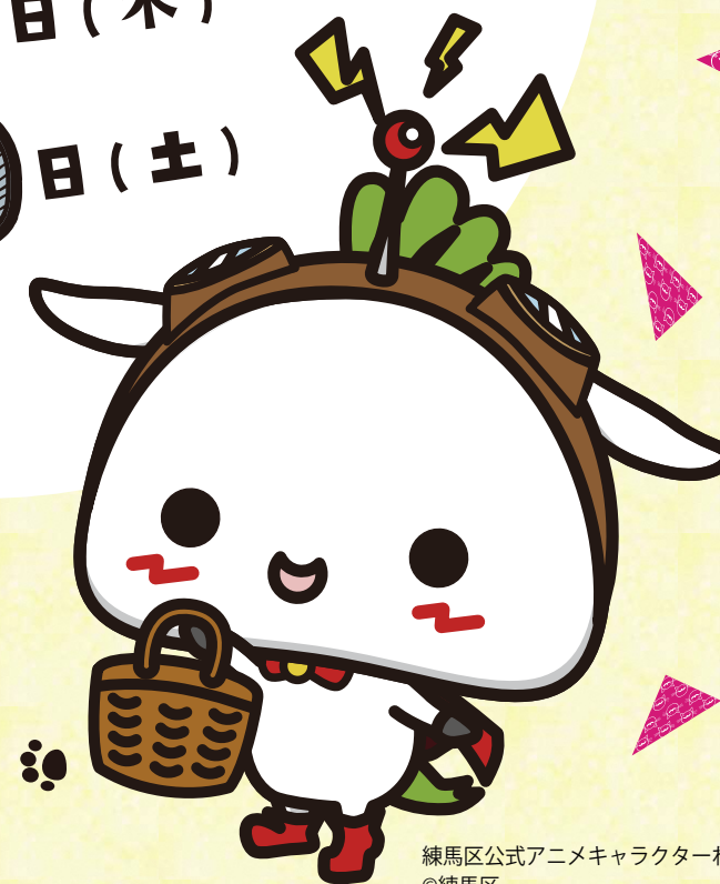
練馬区公式アニメキャラクターねり丸