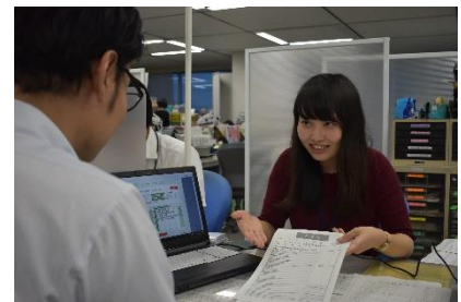
子育て支援課窓口の様子