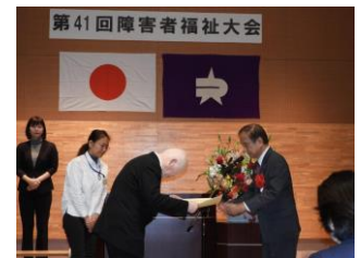
▲障害者福祉大会(昨年度)の様子

地域で活躍している障害のある方や、障害者福祉の向上に寄与した方を表彰する。障害者福祉の向上に功績のあった方8人と、インドネシア2018アジアパラ競技大会などで活躍された方5人の計13人を表彰予定。