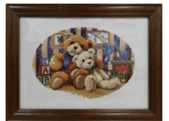
▲障害者ふれあい作品展(今年度)の出品作

区内の障害者施設の利用者や団体などが制作した絵画や陶芸など180点を超える作品を展示する予定。今年で8回目を迎える。入場無料。