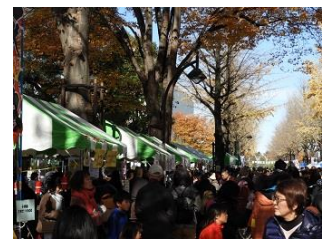
▲障害者フェスティバル(昨年度)の様子

当日は、区内43の福祉団体・施設が参加。ふれあいコンサートでは手話コーラスなどを披露する。また、障害のある方が制作した作品の展示やたくさんの模擬店が並び、自主製作品をはじめ、温かい食べ物などを販売する。その他、健康チェックコーナーやスタンプラリー、ハンドスタンプなどを実施する予定。