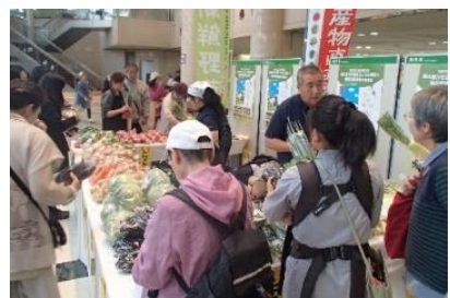
▲昨年の即売会の様子