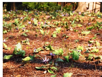
▲群生して咲くカタクリ (平成29年3月28日撮影)

カタクリは、種子から花が咲くまでに7～8年かかり、草丈は10cmほど。2枚葉を出し、2枚の葉から出る茎の先に花をつける。花は通常薄紫色で下を向き、6枚の花びらを外に反り返らせて咲くのが特徴。一株の開花期間は一週間程度で、例年3月下旬から4月上旬にかけて次々に咲き始める。