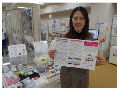
▲リーフレットと防災学習センター(防災展示室)