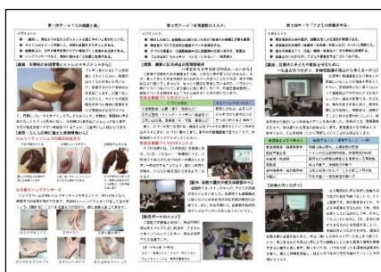
▲リーフレット中面