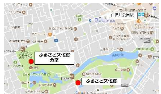
石神井公園ふるさと文化館と同館分室