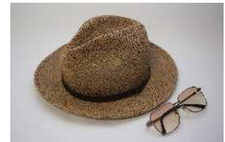
愛用の麦わら帽子とサングラス (石神井公園ふるさと文化館分室)