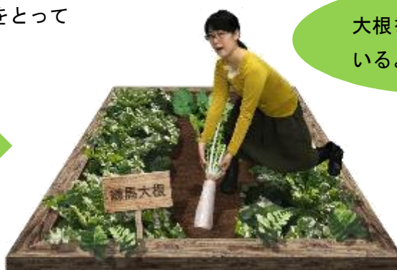
▲オリジナル作品「練馬大根抜き」