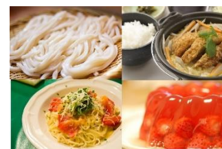
▲看板メニュー(イメージ写真)