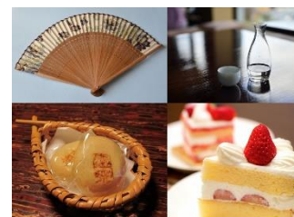
▲お土産品(イメージ写真)

ねりま観光センター(一般社団法人練馬区産業振興公社内) ☎03-4586-1199