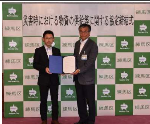
協定締結式の様子