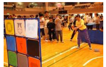
ユニバーサルスポーツフェスティバル(昨年の様子)