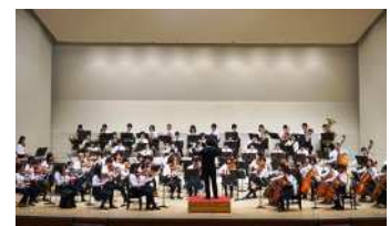
ユニバーサルオーケストラコンサート(イメージ)