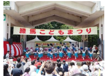
▲ステージでダンスを披露する子どもたち(昨年の様子)