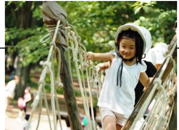
▲丸太の上を歩くモンキーブリッジで遊ぶ子どもたち(昨年の様子)