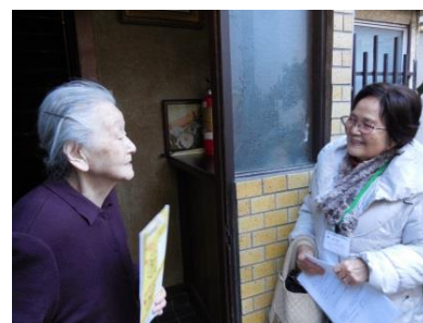
▲区民ボランティアによる訪問の様子