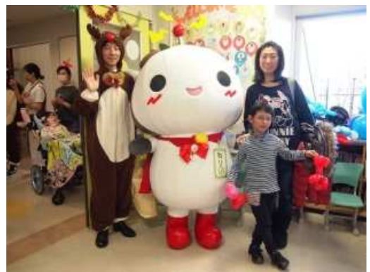
ねり丸サンタ訪問の様子