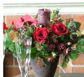
アレンジメント （イメージ）