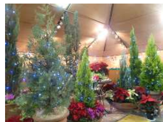
花とみどりのクリスマス展