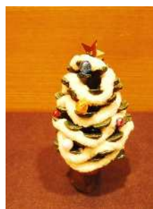
松ぼっくりの クリスマスツリー

内容：緑化協力員と一緒に、自然の素材を使って松ぼっくりのクリスマスツリーなどの作品を作ります。