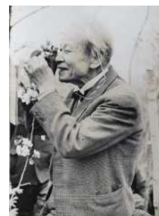
花を観察する 牧野富太郎