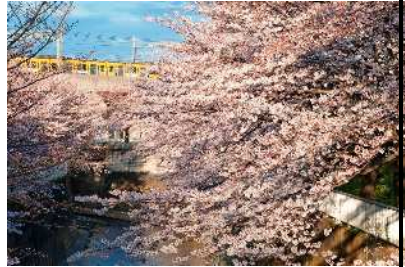
石神井川沿いの桜