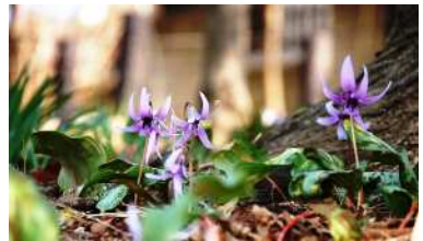
清水山憩いの森のカタクリ群落