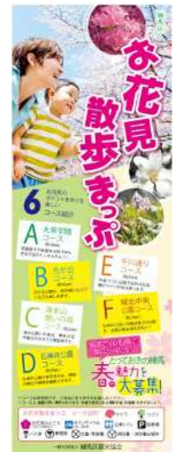
お花見散歩マップ (表紙)

また、区内の花や見どころ、自分しか知らない面白情報など、区内の魅力を写真に撮って投稿する「とっておきの練馬」プロジェクトを練馬区との共催であわせて実施する。投稿者の中から抽選で100名に、松竹大歌舞伎観劇ペアチケットやとしまえん夏の1日ペア券など区内で楽しむことができる「とっておきの景品」が当たる。