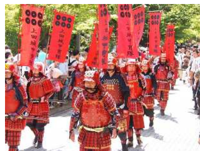
昨年の照姫まつりの様子(真田の甲冑隊)