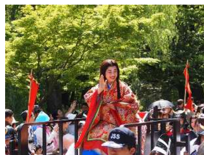
昨年の照姫まつりの様子(照姫行列)

今年は、友好都市であり、大河ドラマ「真田丸」の舞台である長野県上田市と連携し、真田家にちなんだイベントで盛り上げます。