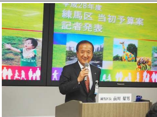
【記者会見を行う前川区長】

今後、広範な区民の皆様のお力を頂きながら、練馬区の可能性を最大限花開かせ、豊かで美しく、後世に誇れるまちを目指して全力で取り組んでまいります。」と今後の決意を語った。