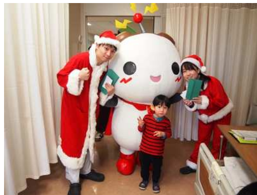
ねり丸と一緒に記念撮影