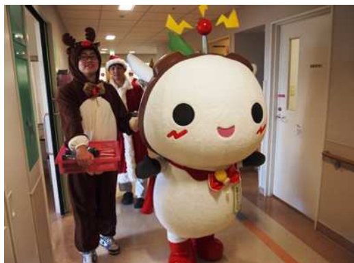
子どもたちの病室へ向かうねり丸