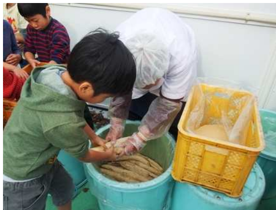
【うまく漬かりますように】