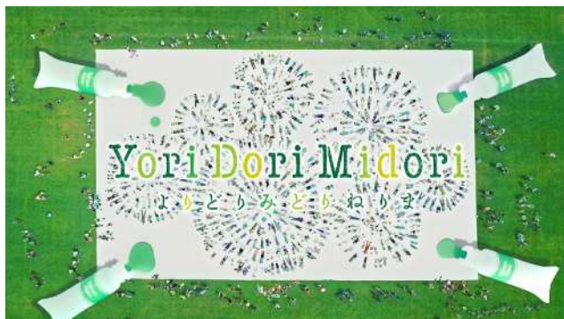
【TV-CM「グリーンアート篇」カット画像】

絵具として実物化された「NERIMA GREEN(5色)」は今後、区のイベントなどプロモーションに使用され、様々な場所で活用していく予定です。