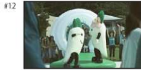
囲まれたこの街では、