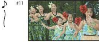
NA) たくさんの“みどり”に