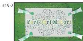
NA) よりどりみどり練馬