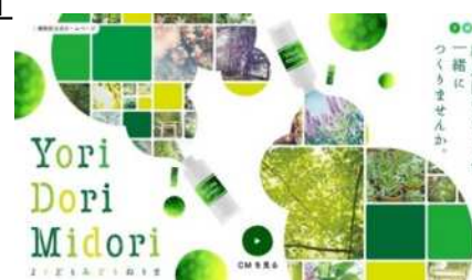
【「Yori Dori Midori 練馬」プロジェクト キービジュアル】

プロジェクトサイト: http://www.yoridorimidori-nerima.jp 練馬区公式ホームページ: http://www.city.nerima.tokyo.jp/