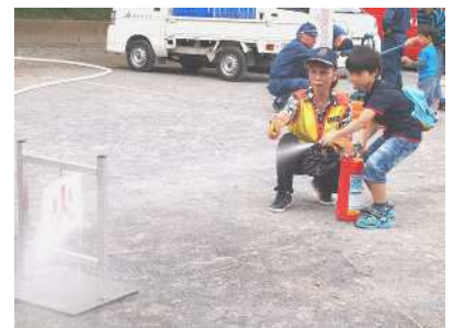
【初期消火訓練 昨年の様子】

炊き出し訓練では、近隣住民で組織する避難拠点運営連絡会が、カレーライスと豚丼(合計1,000食)を提供する。