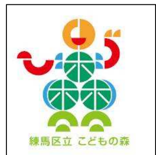
【こどもの森ロゴマーク】

【問い合わせ】練馬区 みどり推進課 みどり計画係 電話 03 - 5984 - 1659