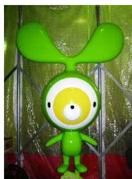
【練馬美術館キャラクター ネリビー(案内役)】