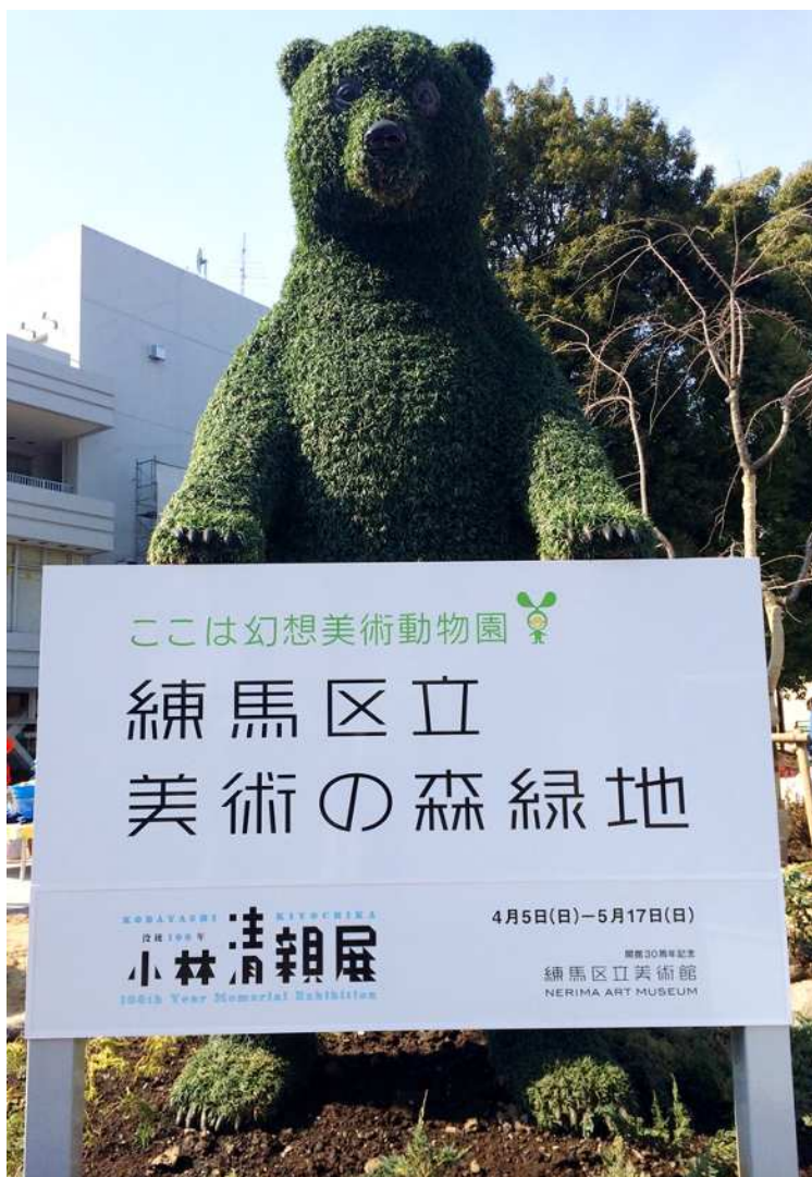
4mのクマがお出迎え