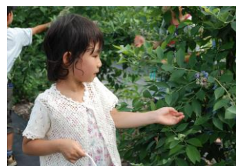
子どもの背丈でも摘み取りができる

ブルーベリーの木は背が低いことから、幼い子どもでも、たくさんの実を摘み取ることができ、身近な夏休みのファミリーレジャーとしても利用者が年々増加している。さわやかな酸味とともに甘い果汁が口の中で広がるブルーベリーは、帰宅しても手軽にアイスクリームやヨーグルトと共に食べられ、ジュースにしてもよい。