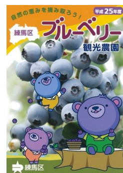
平成25年度練馬区ブルーベリー観光農園 パンフレット

配布場所： 区役所や出張所などの区立施設、練馬区観光案内所、JA東京あおば直売所