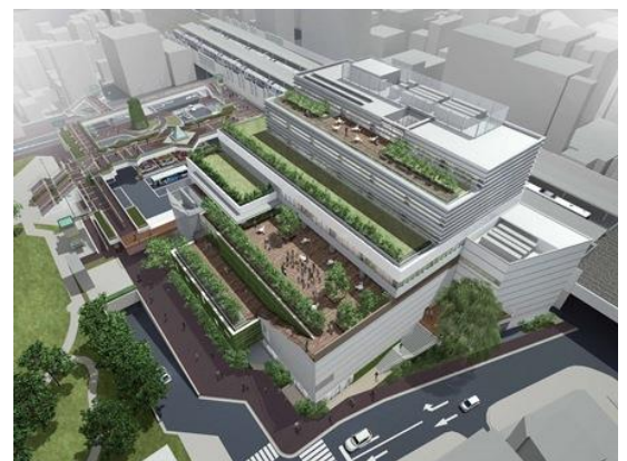
完成予想図(北西から練馬駅方向を望む)

平成25年 5月～ 名称の募集・選定・決定 10月 名称の発表 平成26年 3月 施設の竣工 4月以降 施設の開設