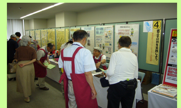
●消費生活展ねりま