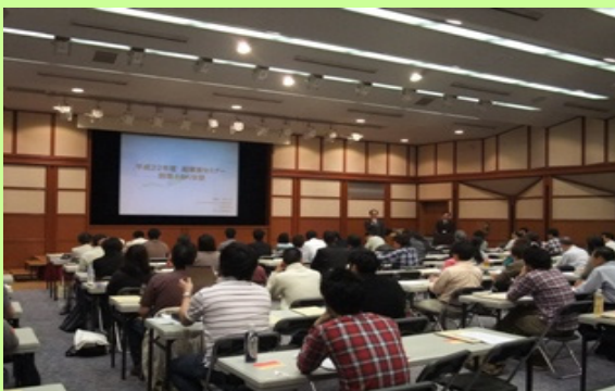
●起業家セミナー「創業！ねりま塾」