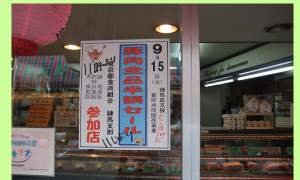
●生鮮三品共同販売事業