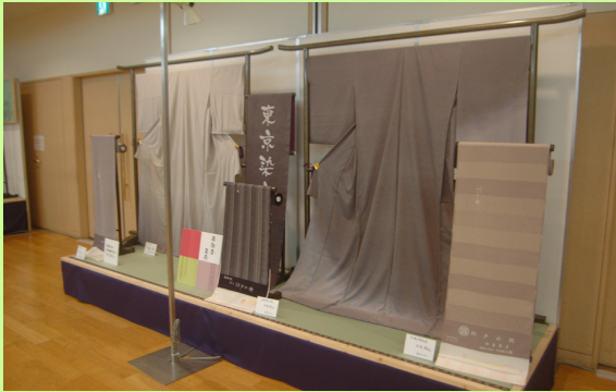
●練馬区伝統工芸展