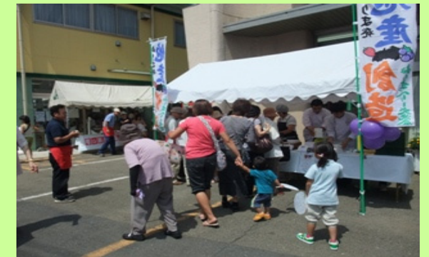
●異業種交流事業 「ベリーフェスティバル」