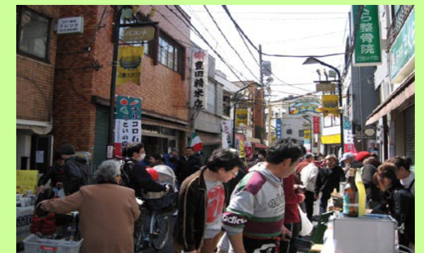
●商店街のイベント「テルコロ石神井公園」