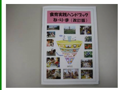
平成21年1月改訂 健康部