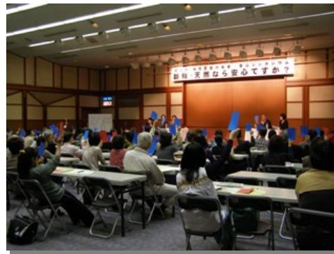
第6回練馬区食の安全・安心シンポジウム 新鮮・天然なら安心ですか? ～食品選びの新常識～