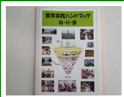
平成20年2月発行 健康部