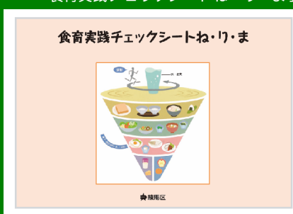
平成22年12月発行 健康推進課