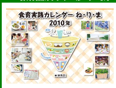
平成22年1月発行 健康推進課