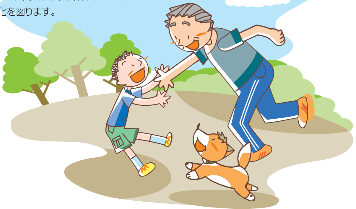
施策の成果を測る指標と目標値

区が誘致した日大練馬光が丘病院と順天堂練馬病院を中心とする、災害時医療救護体制を構築するとともに、地域住民、関係機関、関係団体との連携強化を図ります。