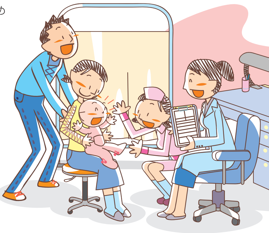
施策の成果を測る指標と目標値

かかりつけ医の紹介等の電話相談件数を増やすため、練馬区医師会が実施する「医療機能連携推進委員会」の運営を支援し、練馬区医師会、日大練馬光が丘病院、順天堂練馬病院等の医療機能の連携を推進します。