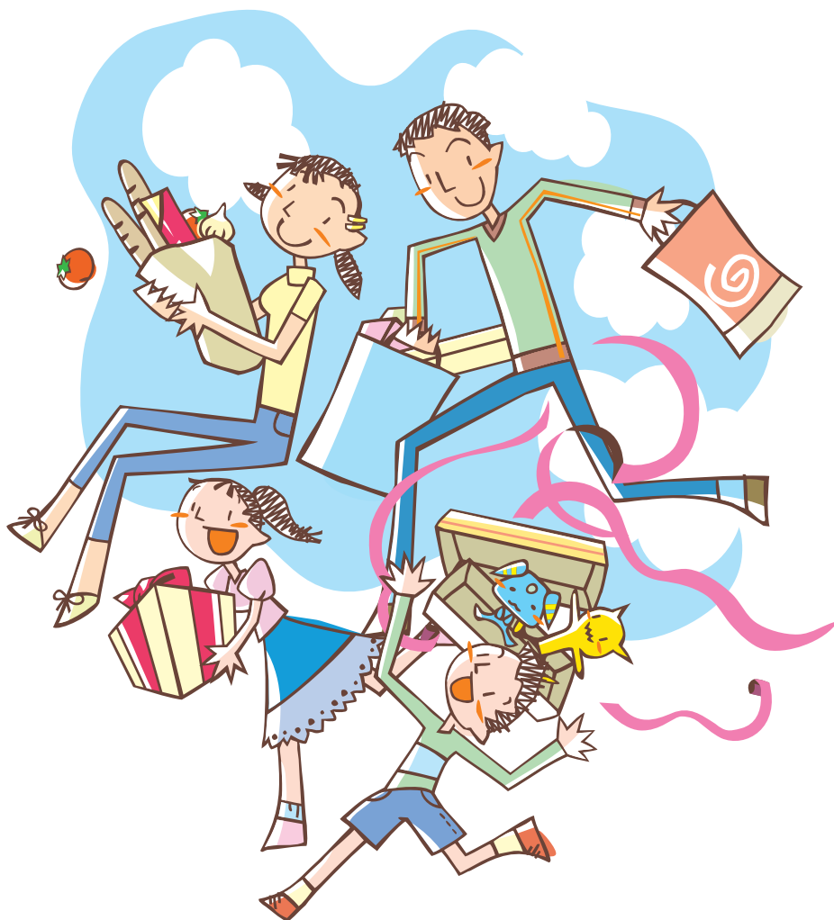
施策の成果を測る指標と目標値

区民、事業者、および区が喫煙に関する共通認識を持つためのルール作りや受動喫煙(注)を防止するための対策を検討し、たばこを吸わない人も吸う人もお互いに気持ち良く暮らせる健康的な環境の実現を目指します。