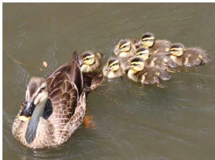
カルガモ（区内で撮影）