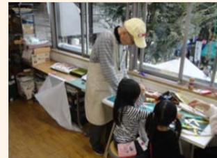
リサイクル工作 (リサイクルセンター)

リサイクルセンターの役割のひとつである環境学習機能を拡充するため、リサイクルセンターが実施する環境学習事業を支援していきます。全区的な環境学習と地域性を活かした事業を進めます。