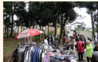
リサイクルマーケット

リサイクルマーケットの主催者団体や、ごみの減量や資源化に自主的に取り組む地域団体に対し、引き続き支援を継続します。区民や地域団体がごみ減量や資源化を進めるための提案について、区として支援する方策を検討します。