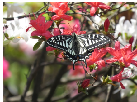
アゲハチョウ（区内で撮影）