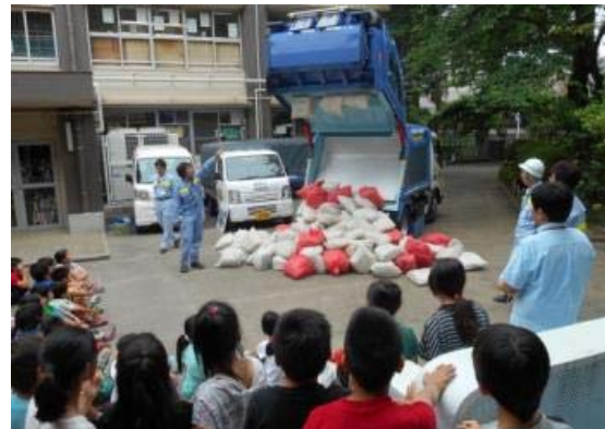
ふれあい環境学習（小学校）