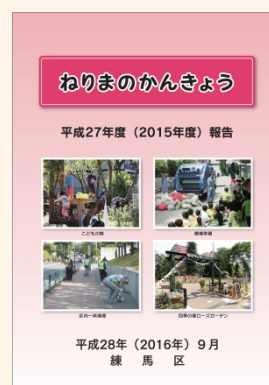
環境報告書 「ねりまのかんきょう」

区の環境の状況や環境保全施策の実施状況を、環境報告書「ねりまのかんきょう」やホームページにより公表します。