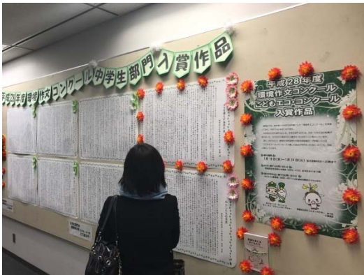
練馬区環境作文コンクール作品展示

また、環境に関する知識や技術をもつ区民、事業者と区の連携・協力や環境保全活動・環境教育を担う人材の育成や活動の場の創出により、地域における協働の取組を広げていくことをめざします。