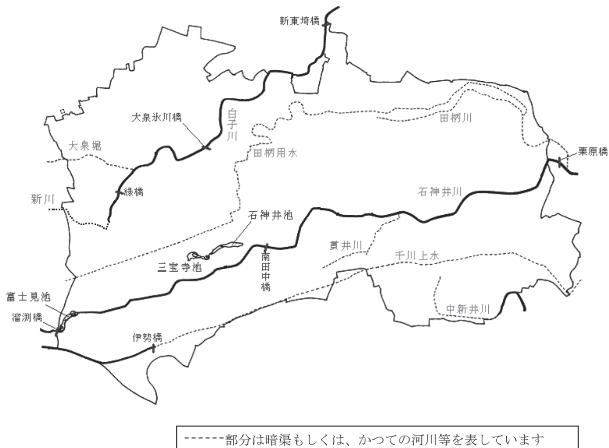
図1 区内の河川・池と水質調査場所

石神井川、白子川ともに、下水道が完備し、大雨後の下水道越流水以外の生活排水は流入しなくなったことに起因し、平成10年頃までは水質の改善が続きました。以降は、ほぼ横ばいで推移しています。