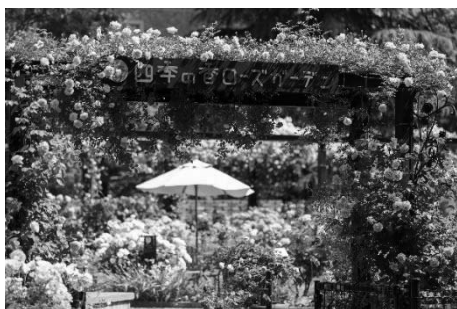
四季の香ローズガーデン