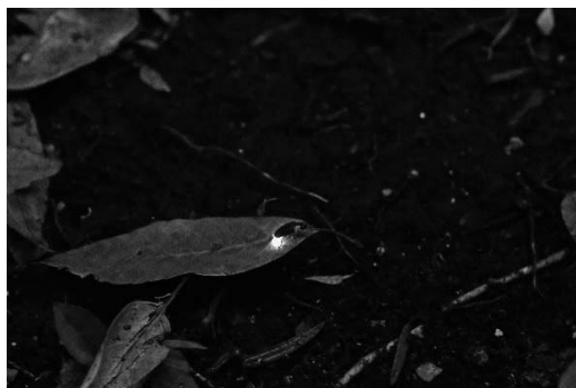
中里郷土の森緑地のホタル

平成29年3月にみどりや生き物と触れ合う体験ができる施設として開園した緑地です。周辺の町会や商店会の協力を得て毎年、ホタルの観察会を開催しています。令和3年度の来園者数は10,636人でした。