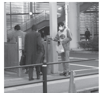
キャンペーンの様子

令和2年度は区内3駅周辺（11月 大泉学園駅、3月 豊島園駅）において啓発用ティッシュペーパーや携帯用吸い殻入れの配布を行い、まちの美化の推進、喫煙マナーの向上を訴えました。