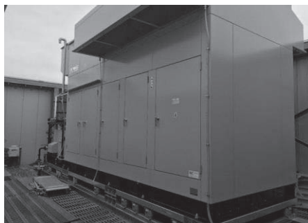
順天堂大学医学部附属練馬病院に設置したコジェネレーションシステム

令和 3 年 3 月に、順天堂大学医学部附属練馬病院と石神井東中学校との間で運用を開始しました。令和 4 年度には、公益社団法人地域医療振興協会練馬光が丘病院と光が丘秋の陽小学校との間で運用開始をする予定です。