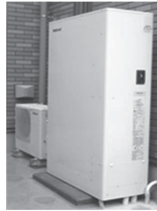
自然冷媒ヒートポンプ給湯器(エコキュート)