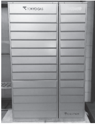
家庭用燃料電池システム(エネファーム)