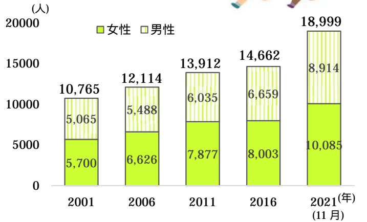
練馬区の在住外国人の推移

練馬区が令和2年に外国人住民に行ったアンケート調査(回収数1,214件)によると、国籍別では中国が一番多く、次いで韓国。また、練馬区で生活する上で困ったり不満に思った経験では、「特になし」が43.1%。次いで社会保険や税金に関することでした。