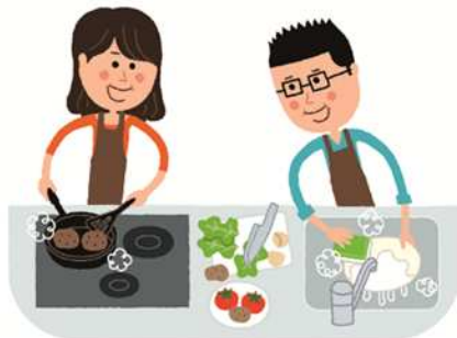
料理 男女どちらでも