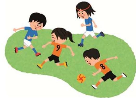
サッカーも男女で