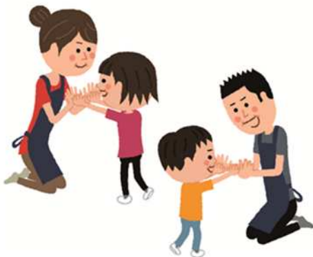
保育士・幼稚園教諭 男女どちらでも