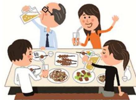
ビール・ジュース 好きなものは性別関係なし