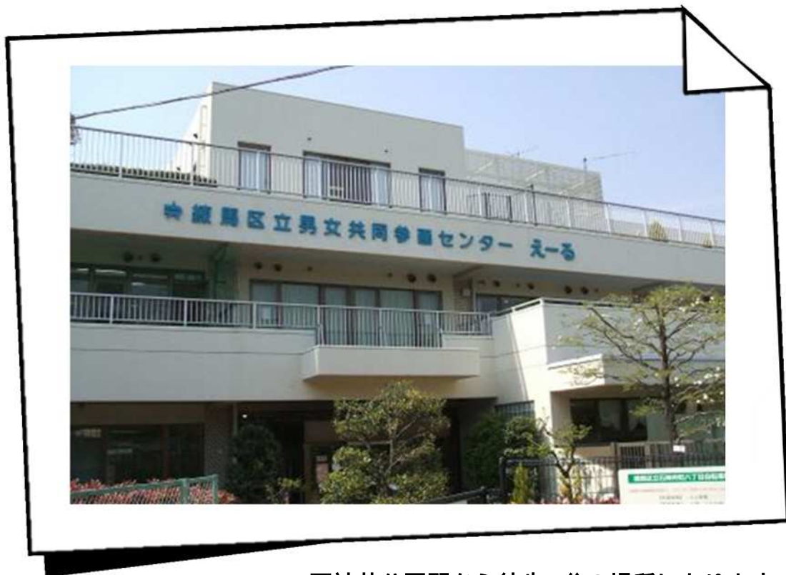
石神井公園駅から徒歩6分の場所にあります

男女共同参画に関する講座やイベントを実施しています。保育室があり、子育て中でも参加しやすくなっています。様々な相談ができる相談室があり、会議室等、施設の貸出しも行っています。