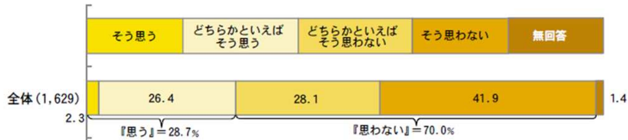
1週間に充てる家事等の時間（男女の比較）